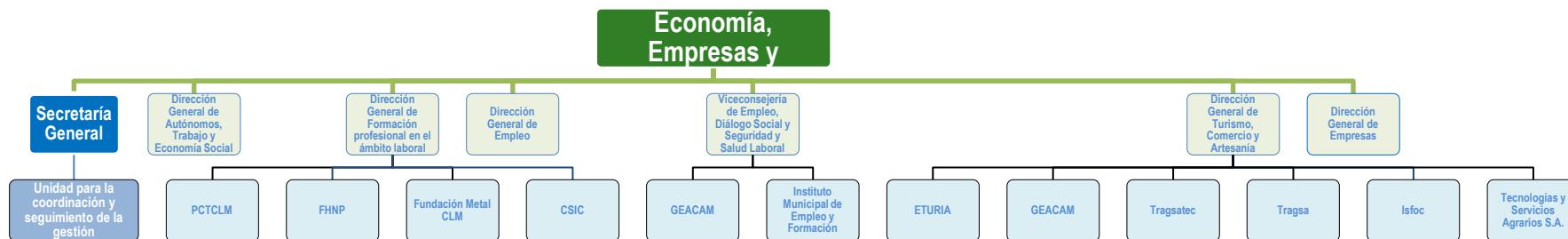
Ilustración 1: Unidades participantes en las medidas antifraude