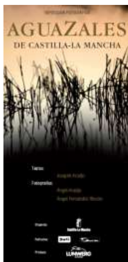
Velero de presentación