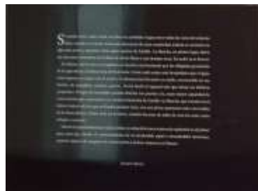
Carteles de presentación