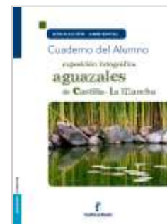
Cuaderno del alumno