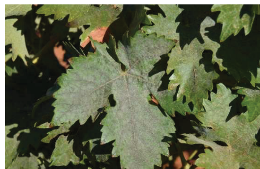
Síntomas de oidio en hojas

La temperatura es el factor climático que tiene más influencia. A partir de 15°C comienzan a ser favorables para su progreso vegetativo y propagación. El óptimo se alcanza entre los 25 y 28°C, temperaturas por encima de 35°C pueden detener su desarrollo y, temperaturas de más de 40°C pueden ser letales.