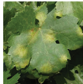
Síntomas de mildiu en el haz de la hoja

El hongo ataca a todos los órganos verdes de la vid, principalmente a hojas y racimos. En primavera y con condiciones favorables, se puede producir la infección primaria, visible por la conocida “mancha de aceite” en el haz de las hojas y pelusilla densa y blanquecina en el envés, si el tiempo es húmedo. Los racimos atacados en el raquis, se oscurecen y se curvan en forma de “S”, con el posterior recubrimiento de una pelusilla blanca si el tiempo es húmedo.