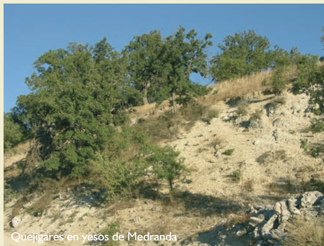
Quejigares en yesos de Medranda