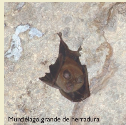
Murciélago grande de herradura