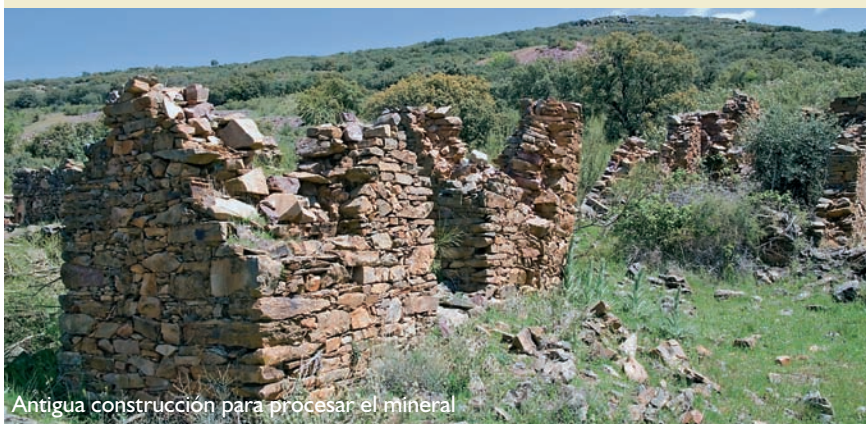
Antigua construcción para procesar el mineral

Época aconsejable de visita y otras recomendaciones: cualquier época del año. Este LIC está en terrenos de propiedad privada. No se recomienda el acceso al interior de la mina, debido al riesgo de derrumbes del techo en algunas de las galerías de la antigua mina, y para evitar molestias a las colonias de murciélagos.