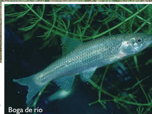
Boga de río