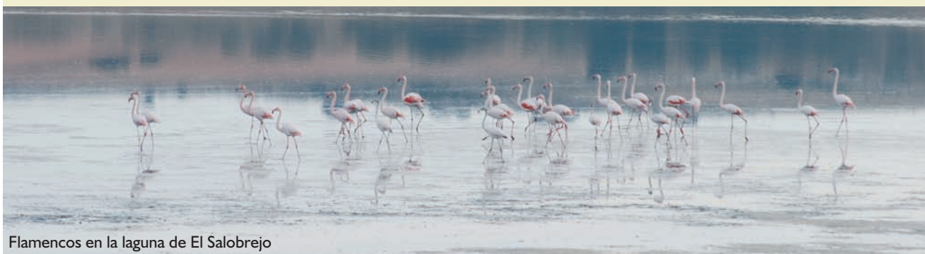
Flamencos en la laguna de El Salobrejo

Época aconsejable de visita y otras recomendaciones: invierno y primavera. Existe observatorio de aves en la laguna de Pétrola.