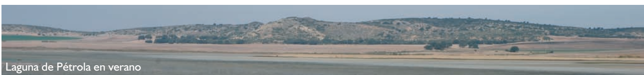
Laguna de Pétrola en verano

El resto de las lagunas (del Salobrejo, Grande y Chica de Corral Rubio, del Saladar, Hoya Rasa, Casa Nueva, Los Hojicos, La Higuera, Casa de la Zarza y Cervalera) de este complejo endorreico presentan una flora y vegetación similar a la de la Laguna de Pétrola, aunque la estacionalidad de todas ellas es muy marcada, siendo éste uno de sus rasgos más característicos.