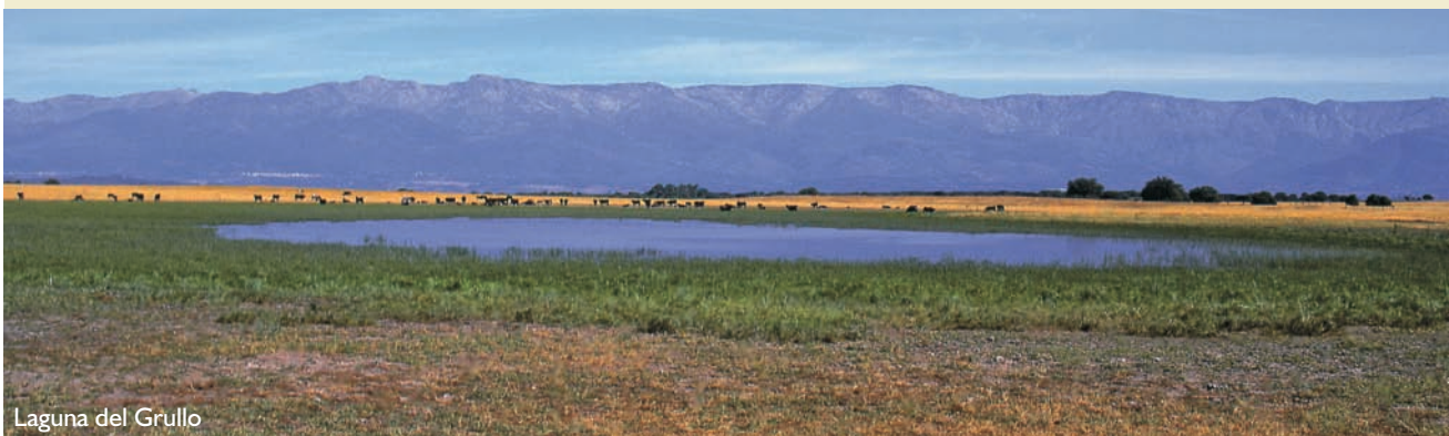
Laguna del Grullo

Época aconsejable de visita y otras recomendaciones: otoño y primavera. Las lagunas están en su totalidad en terrenos de propiedad particular.