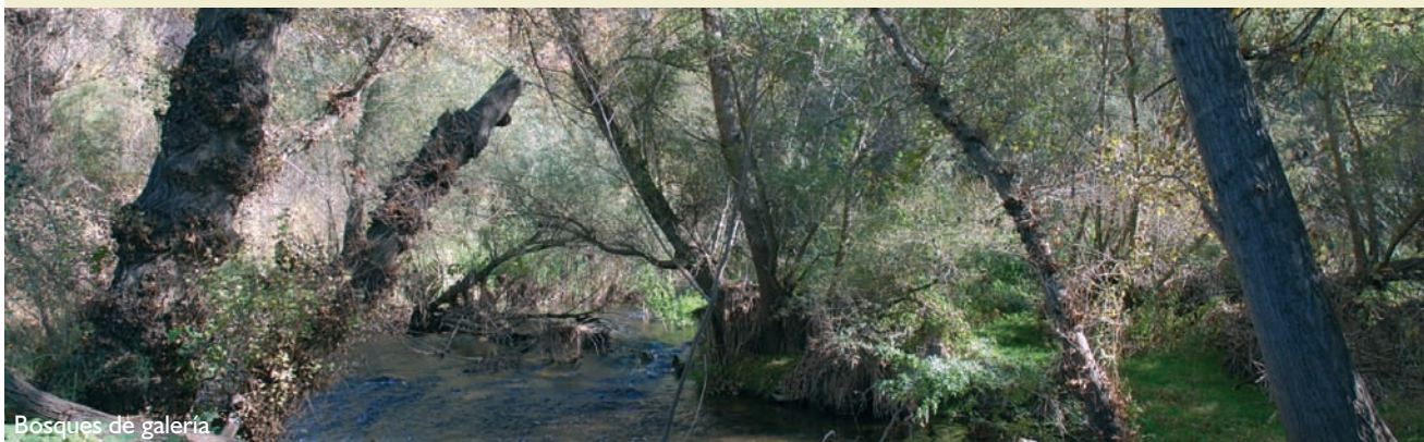
Bosques de galería

Época aconsejable de visita y otras recomendaciones: todo el año.