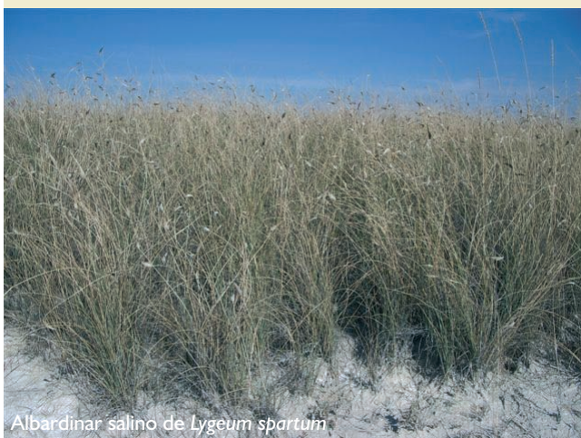
Albardinar salino de Lygeum spartum

Época aconsejable de visita y otras recomendaciones: final del otoño y primavera. Los terrenos son de propiedad privada.