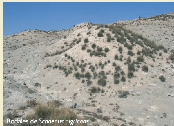
Rodales de Schoenus nigricans