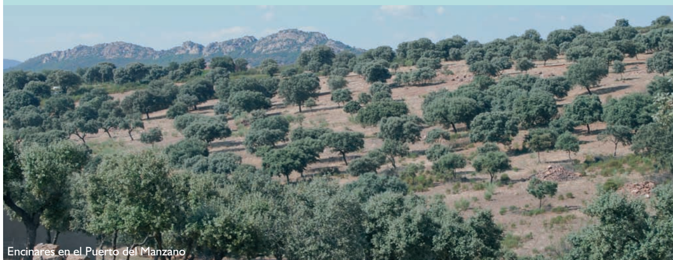
Encinares en el Puerto del Manzano

Época aconsejada de visita y otras recomendaciones: primavera y otoño.