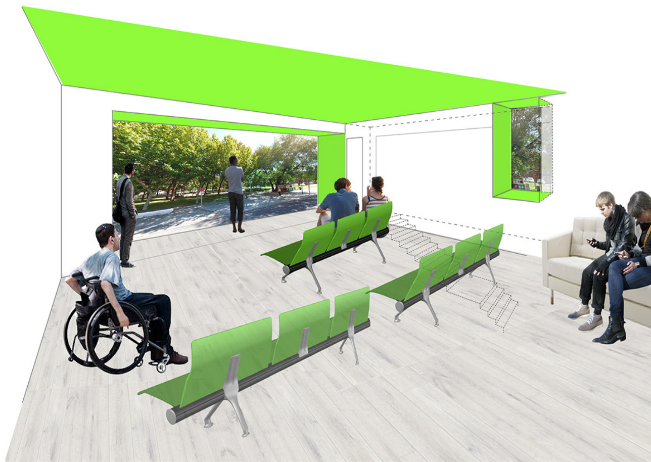
sala espera de familiares